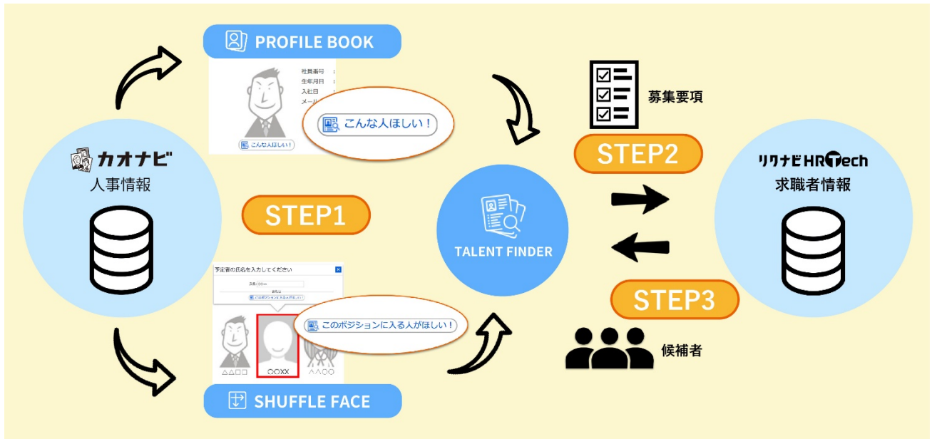
※図 2: TALENT FINDER 使用過程イメージ