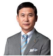
佐々木 則夫 サッカー指導者。2006 年なでしこジャパン（日本女子代表）のコーチに。2008 年からは監督として采配を揮い、北京オリンピックでベスト 4。4 年後のメダル獲得を目指して長期的なチーム作りを開始すると、2011 年 FIFA 女子ワールドカップドイツ大会では世界一、2012 年ロンドンオリンピック、2015 年 FIFA 女子ワールドカップカナダ大会と 3 大会連続でファイナルまで導いて、その指導力と人柄が注目されている。